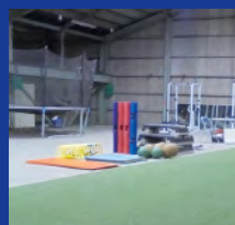
トレーニングスペース