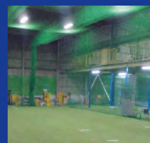
バッティングスペース